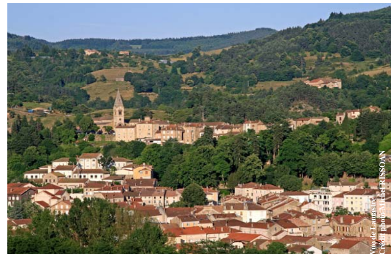
Vue de Lamastre