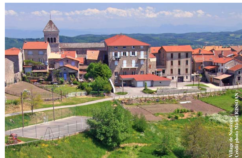
Village de Nozières