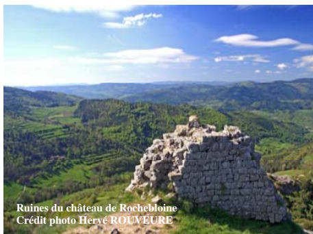
Ruines du château de Rochebloine