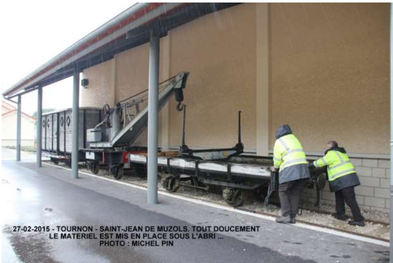
27-02-2015 - TOURNON - SAINT-JEAN DE MUZOLS. TOUT DOUCEMENT LE MATERIEL EST MIS EN PLACE SOUS L'ABRI...