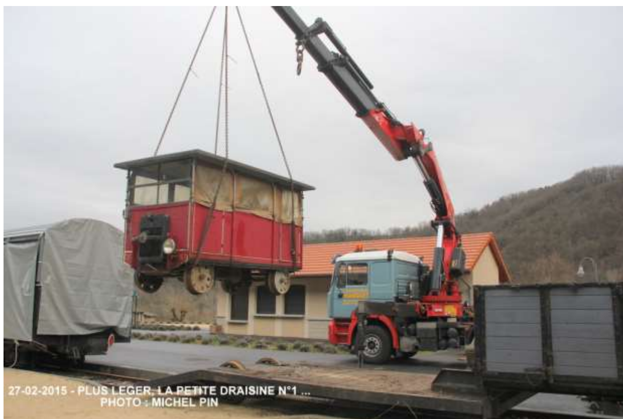
27-02-2015 - PLUS LEGER - LA PETITE DRAISINE N°1...

C'est ensuite au tour de la draine de campagne ...