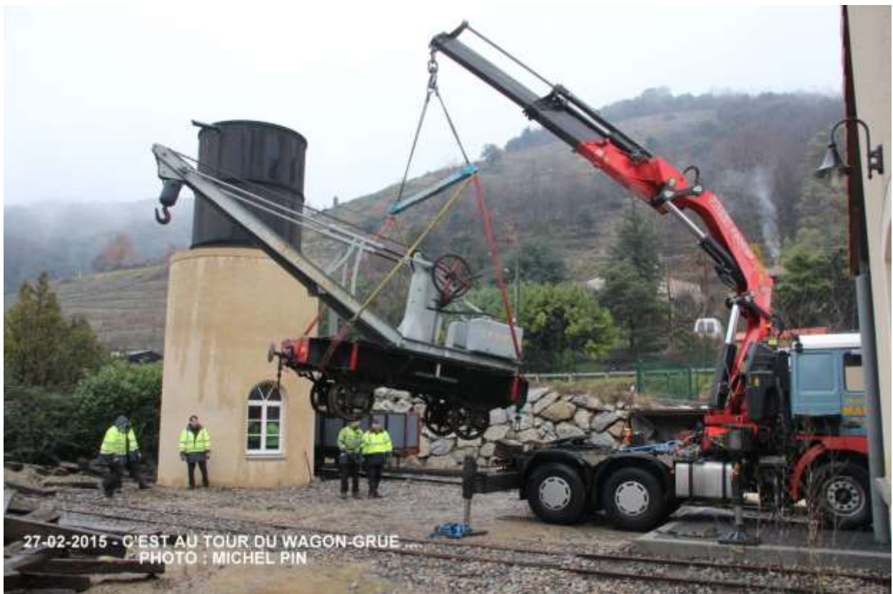
27-02-2015 - C'EST AU TOUR DU WAGON-GRUE

C'est tout d'abord une rame marchandise historique qui est mise sous le auvent.