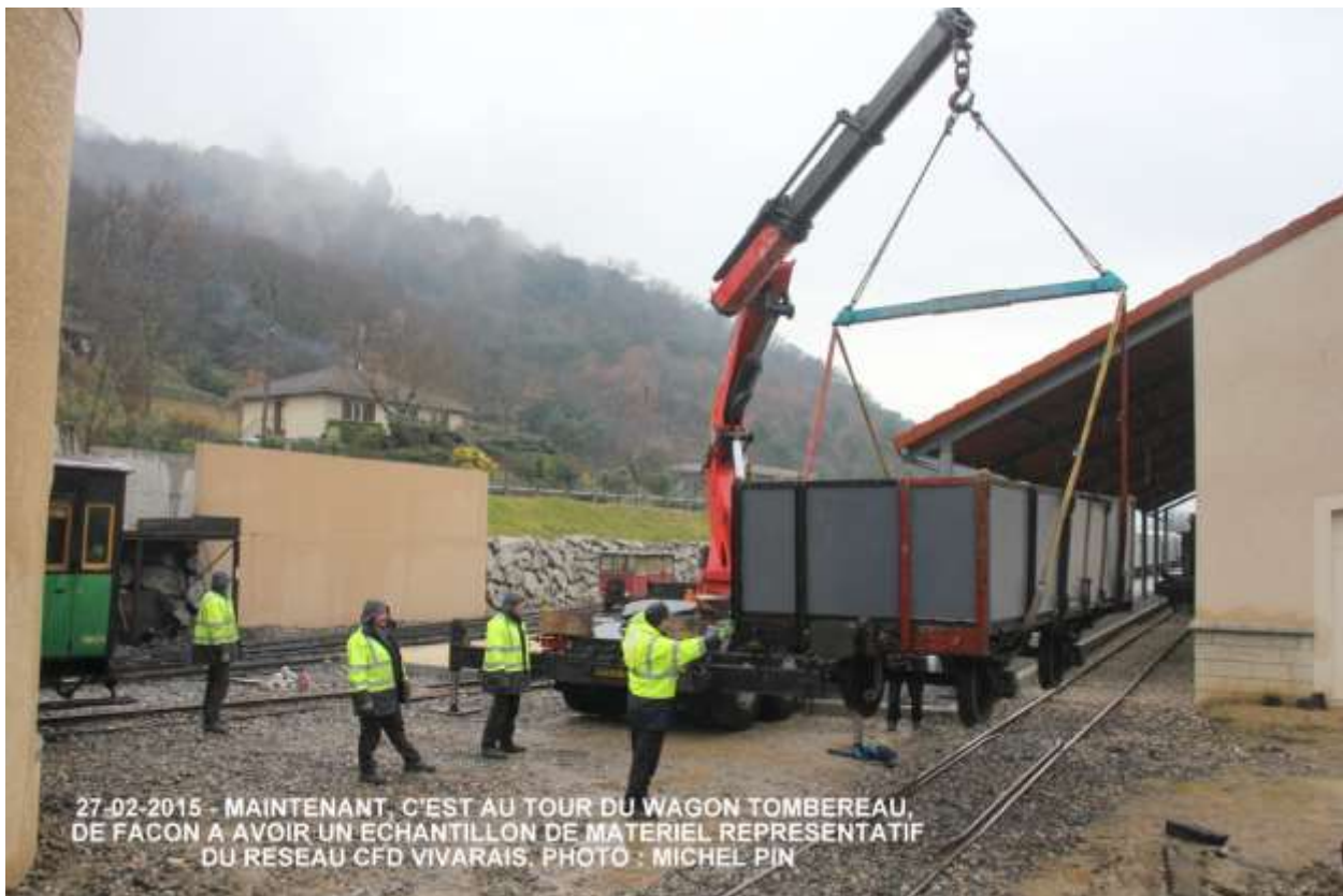
27-02-2015 - MAINTENANT, C'EST AU TOUR DU WAGON TOMBEREAU, DE FACON A AVOIR UN ECHANTILLON DE MATERIEL REPRESENTATIF DU RESEAU CFD VIVARAIS.