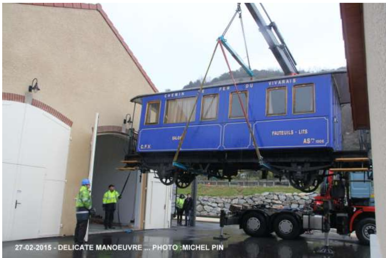
27-02-2015 - DELICATE MANOEUVRE...

C'est ensuite au tour de la draine de campagne ...