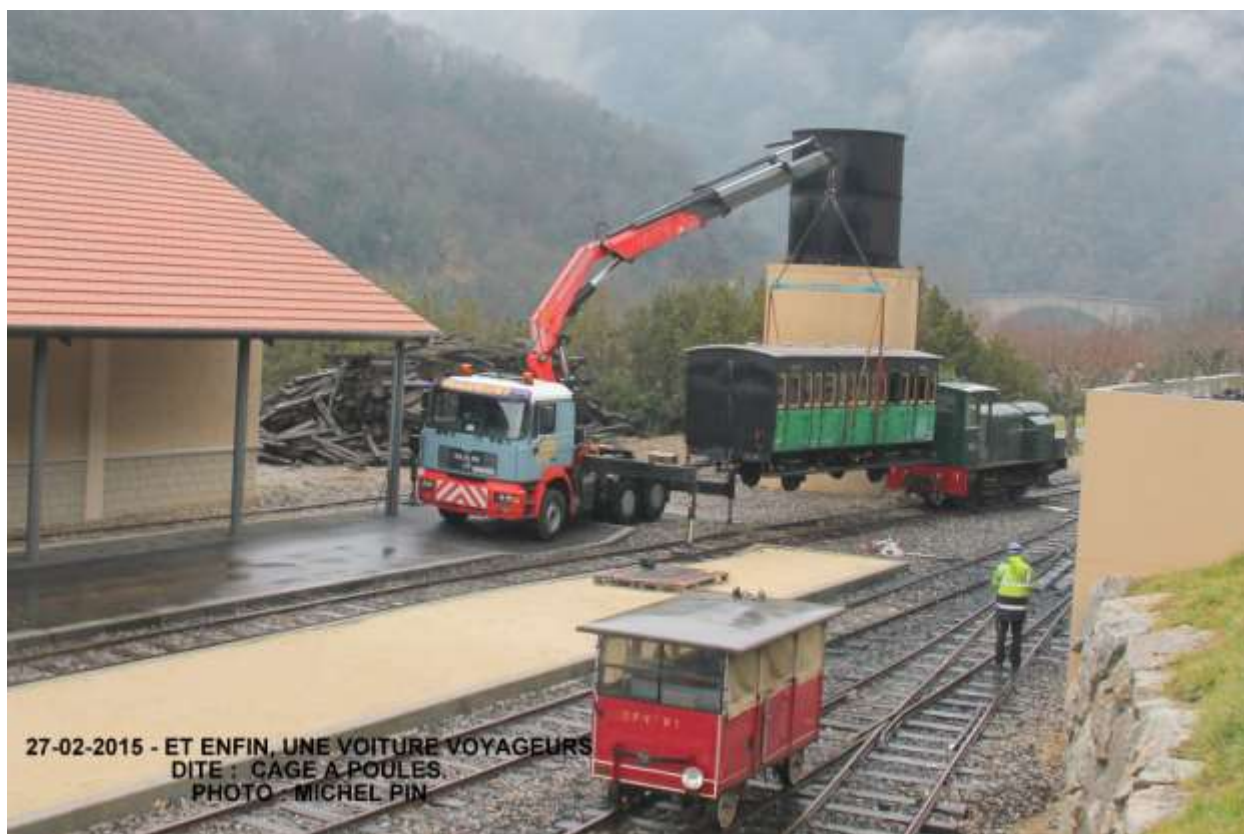
Rame marchandises voyageurs typique des cfd de la fin du 19 ème siècle.