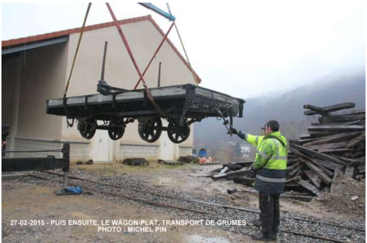
27-02-2015 - PUIS ENSUITE, LE WAGON-PLAT, TRANSPORT DE GRUMES...

C'est tout d'abord une rame marchandise historique qui est mise sous le auvent.