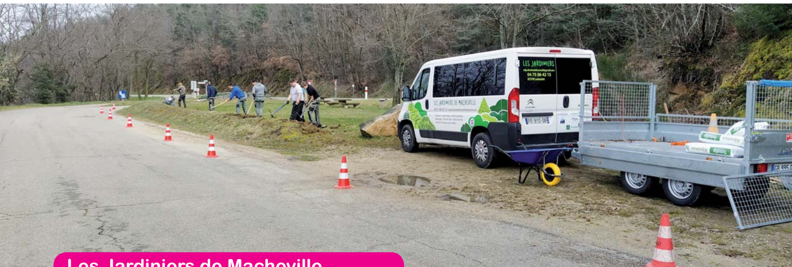
Les Jardiniers de Macheville