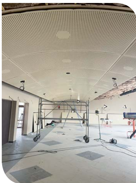
Pendant la pose des faux plafonds

La Communauté de communes du Pays de Lamastre nous accompagnera également, sous forme de fonds de concours.