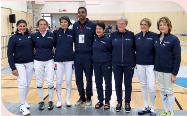
L'équipe qui a participé au Championnat du monde

Pour la deuxième année consécutive, les escrimeuses de l'équipe de France vétérans épée dames étaient en stage de préparation à Lamastre, sous la conduite de Jean-Michel Lucenay (Champion Olympique). Les différentes structures sportives leur ont permis de s'entraîner dans les meilleures conditions.