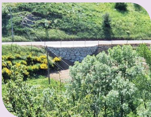
Plate-forme et adductions d'eau et d'électricité à l'Arboretum

Aussi, les agents en charge de la voirie ont refait les fossés de Mathon à Laulagnier et un enrochement a été réalisé au quartier du Bouchet par une entreprise locale.