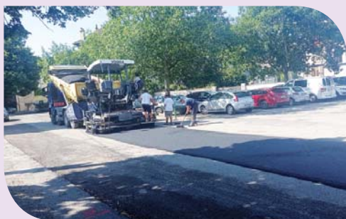
Début du goudronnage place Pradon

La communauté de communes du Pays de Lamastre, en charge de la voirie, a alloué cette année 1 100 000 € pour la réhabilitation des chaussées dans les 11 communes qu'elle regroupe, dont 320 000 € pour Lamastre.