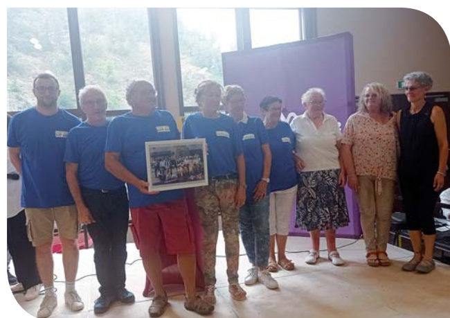
Une partie de l'équipe des bénévoles lamastrois recevant leur prix