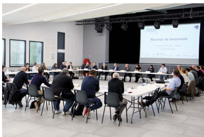
Les acteurs réunis lors de la réunion de lancement le 22 octobre dernier à Guilherand-Granges

Une aide financière pour l'investissement industriel, innovant et ayant une orientation environnementale.