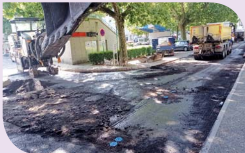
Travaux en centre-ville