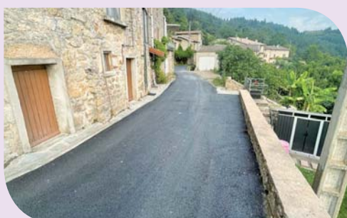
Goudronnage au hameau de Valoan

Cet été, d'importants travaux de goudronnage ont été entrepris transformant le centre-ville, la place Pradon et les rues environnantes. Cela était devenu essentiel pour améliorer la sécurité et le confort des usagers.