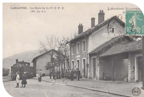
Gare de Lamastre dans les années 1920

Une nouvelle vie inespérée va commencer pour la gare de Lamastre avec en juillet 1969 la réouverture de la ligne Saint-Jean-de-Muzols (puis Tournon) - Lamastre à des fins touristiques.