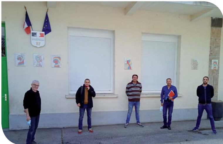
Le mercredi 5 mai, élus et responsables du SDE 07 ont procédé au lancement des travaux de cet important chantier

Depuis 1964, le Syndicat Départemental d'Énergies de l'Ardèche (SDE 07) est le partenaire privilégié des 335 communes ardéchoises pour l'électrification rurale, l'enfouissement des lignes, l'éclairage public, mais aussi pour le gaz, les énergies renouvelables (réseaux de chaleur au bois et photovoltaïque), la maîtrise de la demande en énergies, le cadastre numérisé, l'instruction des demandes d'urbanisme et les bornes de charge pour véhicules hybrides rechargeables et électriques.