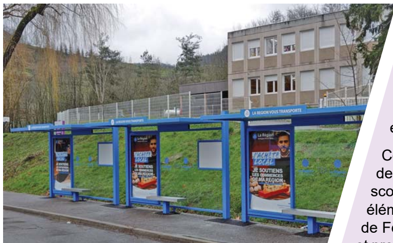
Abribus au collège du Vivarais

C'est avec l'aide de la région Auvergne-Rhône-Alpes que la municipalité a, en janvier et en mars 2021, installé de nouveaux abribus à la gare routière du collège du Vivarais, ainsi qu'en centre-ville de Lamastre.