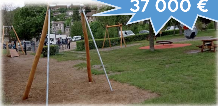
Aménagement de l'aire de jeux du parc de la Pradette