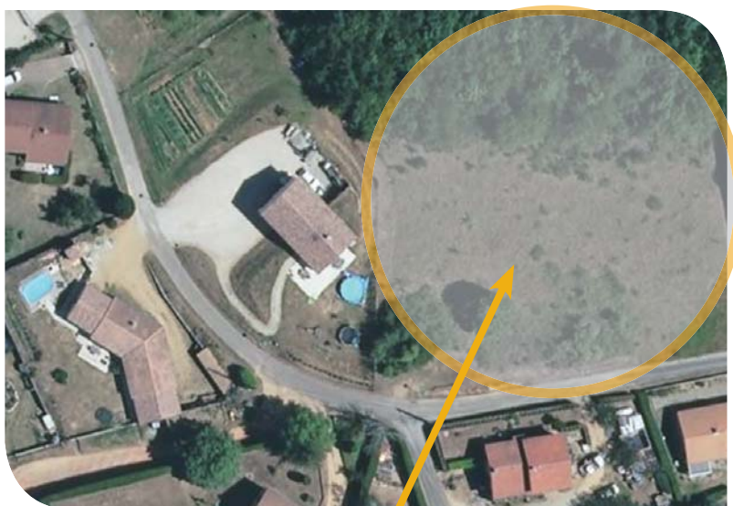
Plan de situation : Emplacement des 3 futurs lots

Prise de rendez-vous en ligne possible via le site internet de la commune : www.lamastre.fr (rubrique « Urbanisme »).