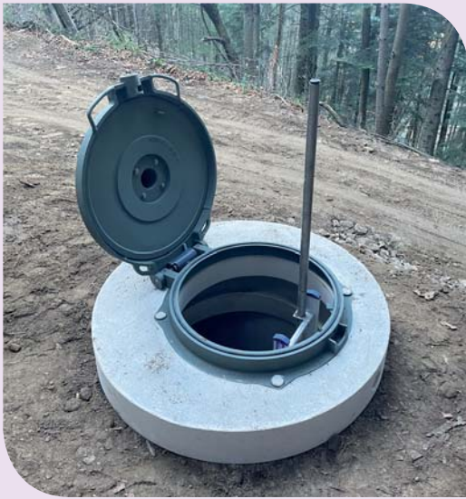
Un des captages de Goutteneyre

D'importants travaux ont été réalisés en ce début d'année pour la mise en conformité et l'amélioration du captage des sources de Goutteneyre qui alimentent la commune en eau potable depuis la fin du 19 ème siècle.