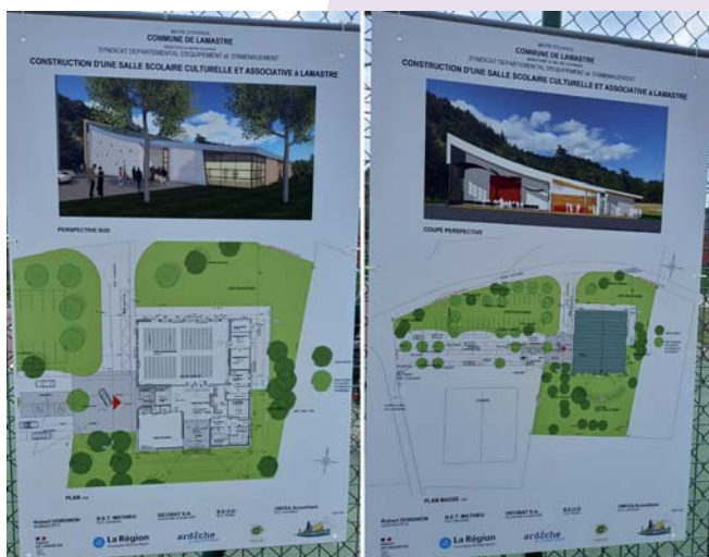
Ces plans sont consultables dans le hall de la Mairie

Longtemps attendu, le projet de construction de la salle polyvalente est désormais lancé !