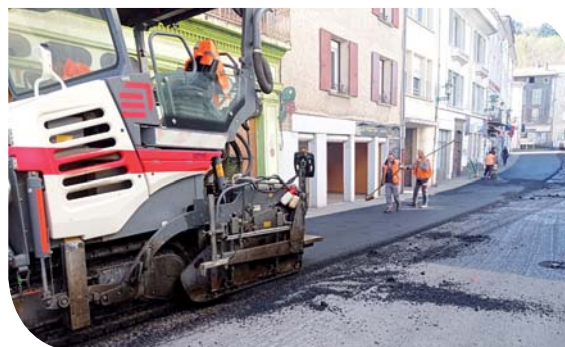
Rue Désiré Bancel

Un chantier indispensable au vu de l'état dégradé de la chaussée qui facilite désormais le trafic des usagers dans le centre-ville.