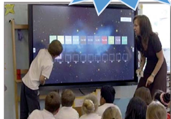
Plan numérique / Purificateurs d'air