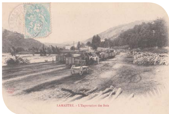
Exportation de bois dans les années 1900

L'inauguration de la ligne ferroviaire de 32,6 km entre Tournon et Lamastre a lieu le 12 juillet 1891, en présence du Ministre des Travaux Publics Yves Guyot et du Ministre de l'industrie, du commerce et des colonies Yves Roche. Ce fut l'occasion de 2 jours de fêtes à Lamastre. Trois trains quotidiens mixtes (voyageurs et marchandises) desservait Tournon en 1h25, avec arrêt dans 5 gares et haltes, un véritable exploit pour l'époque.