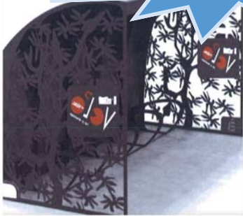
Aménagement d'un accueil vélos